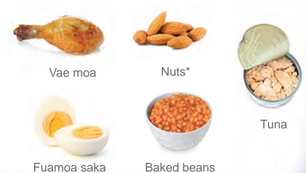
Vae moa Nuts* Tuna Fuamoa saka Baked beans