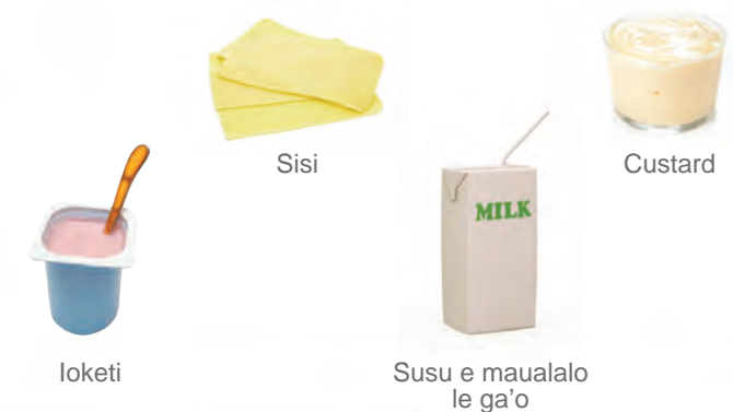
Ioketi Sisi Susu e maualalo le ga'o Custard