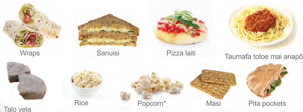
Wraps Sanuisi Pizza laiti Taumafa toote mai anapō Talo vela Rice Popcorn* Masi Pita pockets