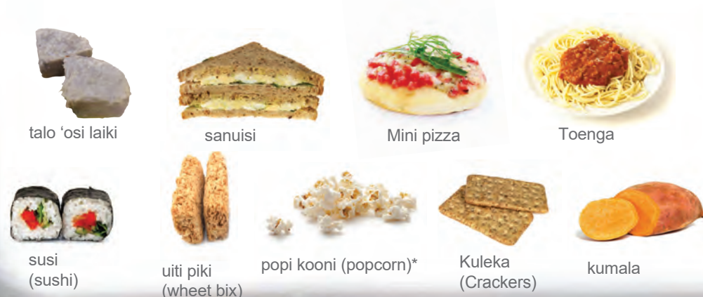
talo 'osi laiki